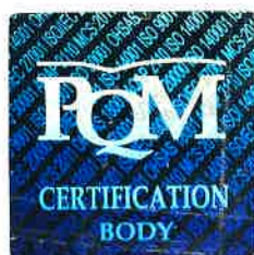
Head of the certification body

Supervisory audit 1: before 11. 07. 2017 Supervisory audit 2: before 11. 07. 2018 Re-certification audit: before 11. 07. 2019